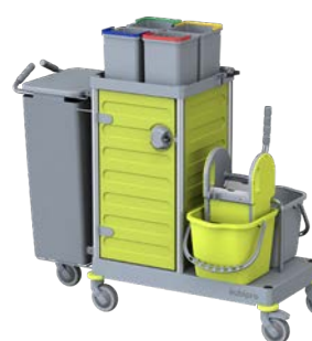
KUBI 4 PRO