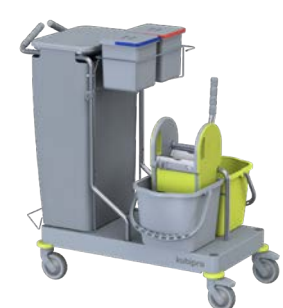
KUBI 6 PRO