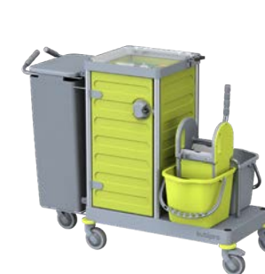
KUBI 5 PRO