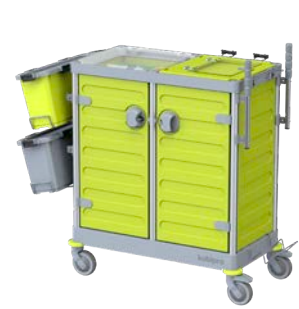
KUBI 2 PRO