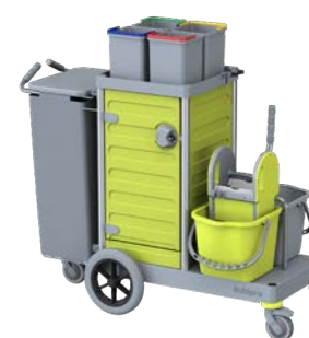
KUBI 4 PRO BIG-FOOT