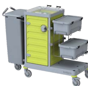
KUBI 3.2 PRO