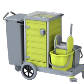
KUBI 5 PRO BIG-FOOT