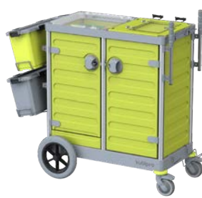
KUBI 2 PRO BIG-FOOT