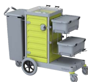
KUBI 3.2 PRO BIG-FOOT