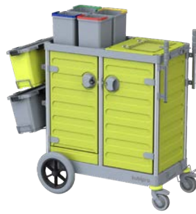
KUBI 1 PRO BIG-FOOT