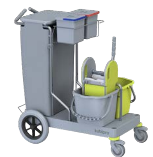
KUBI 6 PRO BIG-FOOT